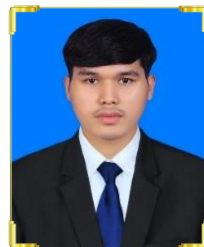
ណា វិធី ID:B22/433