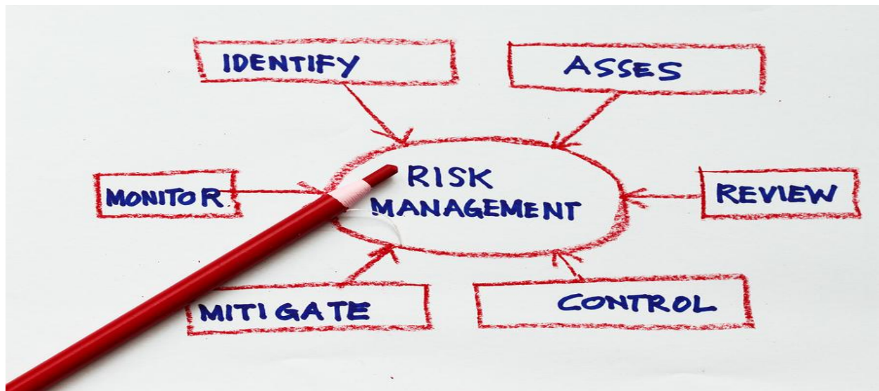
Concept for risk management in a flowchart presentation

ហានិភ័យក្លែងឈ្មោះ គឺជាហានិភ័យកើតឡើងមកពីភាពមិនច្បាស់លាស់ដែលទាក់ទងនឹងគំនិតរបស់សាធារណៈជនដូចជាការយល់ខុសដោយមិនដឹងថាវាពិត ឬមិនពិតក៏ដោយ ក៏អាចជះឥទ្ធិពលអាក្រក់ដល់ការរកចំណូលរបស់ស្ថាប័នហិរញ្ញវត្ថុដែរ ដោយជំរុញឲ្យម្ចាស់បំណុល និងអតិថិជនដទៃទៀតមិនមានជំនឿលើស្ថាប័ននោះ។