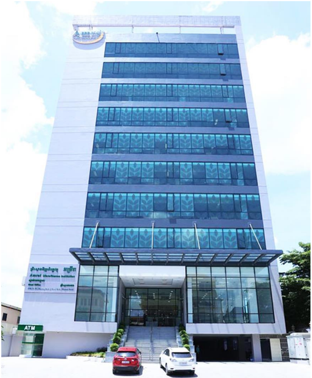
រូបភាពទី១: សំណង់អគារ ការិយាល័យកណ្តាល