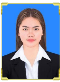
មត ម៉ូលីការ ID: B22/870