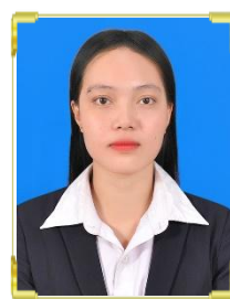
ម៉ែ កេត្យ ID: B22/756