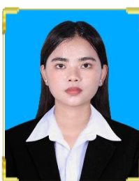
ជ័រ ភីណា ID: B22/621