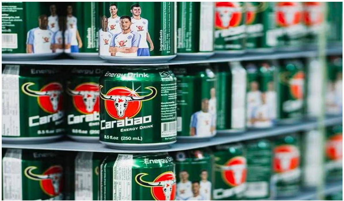
ផលិតផលដែលបានដាក់លក់នៅលើទីផ្សារ