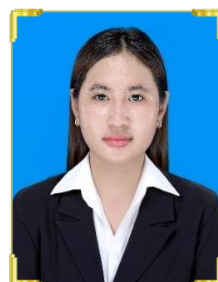
តុនី សីហនុ