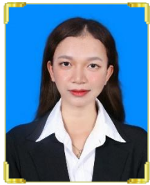
និល ស្រីនិម ID: B22/1823