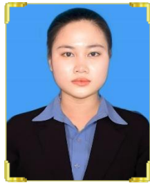
ស្រីង ណែតីម ID: B22/093