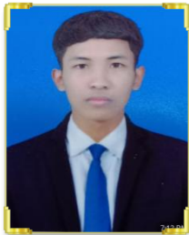
មេស ម៉េង ID: V22/020