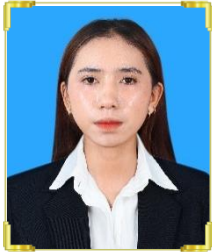
ហាង ទិស្ស័យ ID: B22/1433