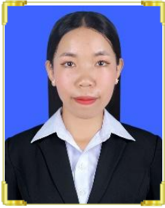
ច្រំ លក្ខិណា ID: B22/634