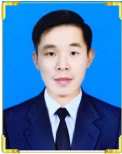
ណ គាតស្រ័យ ID: B22/566