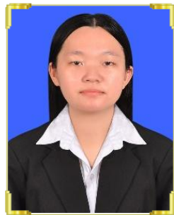
ដា ស្រីឆៀង ID: B22/370