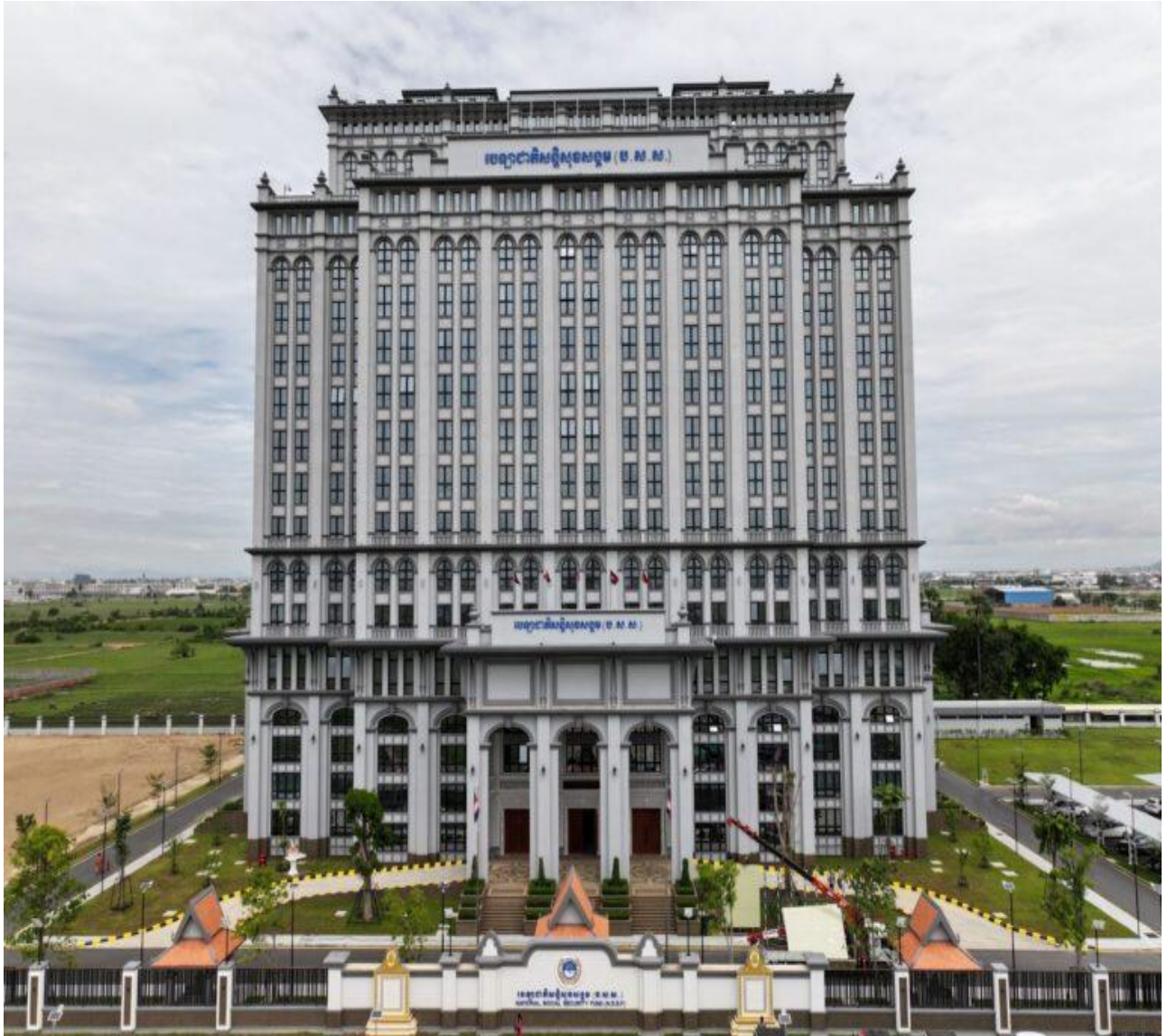
សំណង់អគារ បេឡាជាតិសន្តិសុខសង្គម ខណ្ឌសែនសុខ