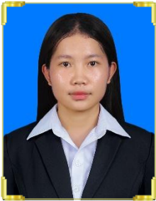
ឡាន់ គន្ធា B22/662