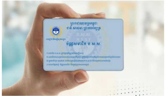
ប័ណ្ណសមាជិកបេឡាជាតិសន្តិសុខសង្គម