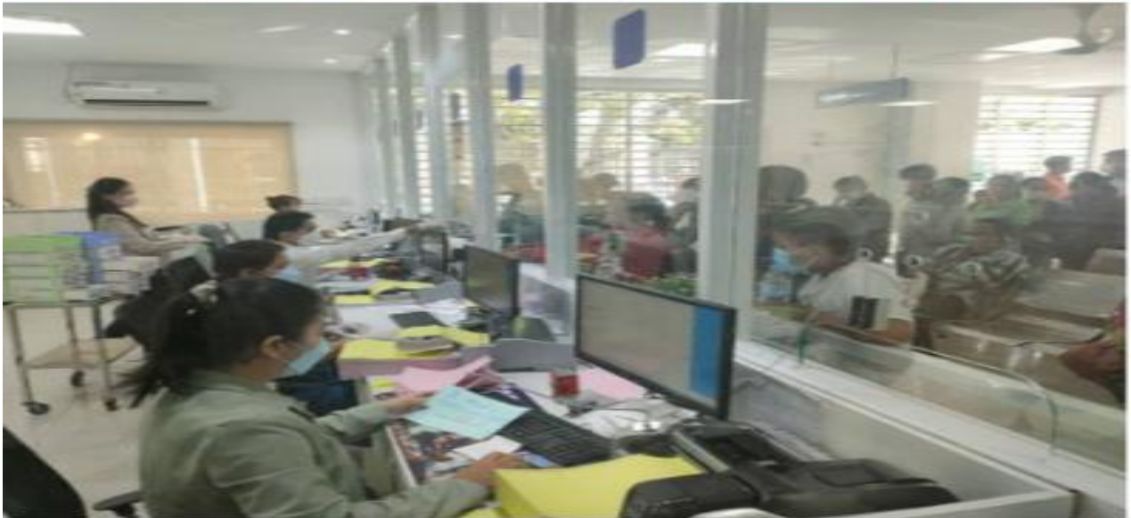
សកម្មភាពចុះបញ្ជីរបស់បេឡាជាតិសន្តិសុខសង្គម