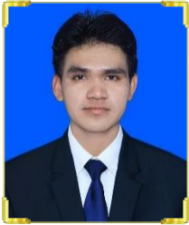
យ៉ា ជិនជិត ID: B22/101