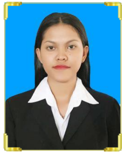
មួង រណីហ្សូ ID: B22/851