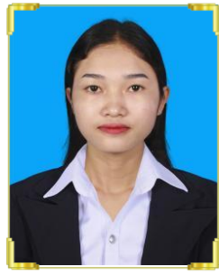
ហ្វា ឡែងម៉ីម ID: B22/1355