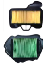
សំបុកអ៊ែរ