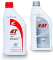
ប្រេងម៉ាស៊ីន