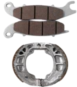
ស្បែកហ្វ្រាំង