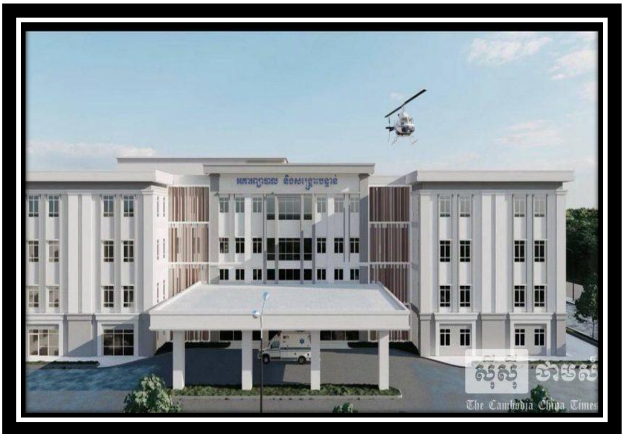
មន្ទីរពេទ្យ «តេជោសន្តិភាព»