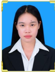
ឡេង ជាតិ ID: B22/1447