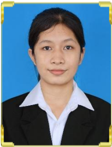
នាយ រក្សា ID: B22/228