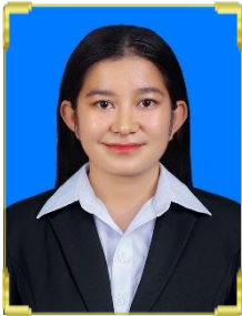
ម៉េត សារ ID: B22/1519