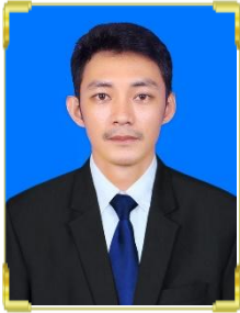
សំ សិណា ID: B22/283