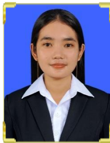
ប្រេង ម៉ីម៉ី ID: B22/1535