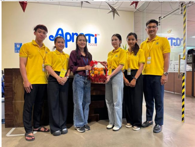
សកម្មភាពរបស់ក្រុមនិស្សិតពេលចុះកម្មសិក្សានៅក្រុមហ៊ុន អេប្រាធី ហ្វឹដ (ខេមបូឌា)