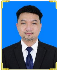
វណ្ណ ជាន់ ID: B22/1117