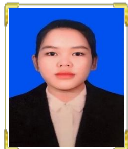
ម៉ៅ ត្រីលីម ID: B22/2440