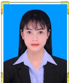
ទុយ ត្រីលីន ID: B22/301